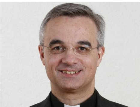
MONS. VALERIO LAZZERI

Mi è stato chiesto di rivolgere una parola ai ragazzi e alle ragazze a cui conferirò il sacramento della cresima a Pentecoste, alle loro famiglie e alle comunità parrocchiali che vivranno con loro questo momento. Lo faccio volentieri per dirvi anzitutto che mi rallegro di questa occasione per conoscervi e incontrarvi, anche se solo per il tempo limitato della celebrazione liturgica. L'invocazione dello Spirito Santo e l'unzione con il crisma, infatti, sono gesti rituali che esprimono con particolare evidenza ciò che il vescovo è chiamato a essere per l'assemblea dei fedeli. Come successore degli apostoli, egli è costituito come garante della continuità tra ciò che è avvenuto allora agli amici di Gesù, cinquanta giorni dopo Pasqua, a Gerusalemme, e quello che continua ad accadere oggi, nella Chiesa, a tutti coloro che si lasciano coinvolgere nell'avventura cristiana. Occorre ricordarcelo continuamente e