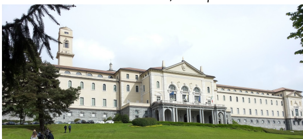
• SEMINARIO ARCIVESCOVILE DI VENEGONO INFERIORE •

Signore Gesù, che sei vivo e vuoi che ciascuno di noi sia vivo, ti preghiamo per il nostro Seminario. Fa' che i seminaristi sperimentino che tutto ciò che tu tocchi diventa giovane, diventa nuovo, si riempie di vita! Ti preghiamo per le nostre comunità: ricche di un lungo passato possano sempre rinnovarsi e tornare all'essenziale per essere luogo di incontro con Te, compagno e amico dei giovani. Ti preghiamo per i giovani che sono alla ricerca della loro vocazione: possano guardare alla loro vita come a un tempo di donazione generosa, di offerta sincera, di sequela a Te. Amen