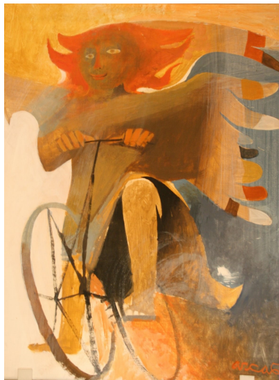
• ARCBAS •

Nella solitudine si affaccia una parola amica, un bussare discreto, la rivelazione della gioia. Nello smarrimento si accende una lampada che indica una via promettente. C'è un braccio forte che prende per mano e dà sicurezza per liberare dalla paralisi e rendere possibile riprendere il cammino. L'angelo di Dio ha annunciato a Maria, ragazza di Nazaret (cfr Christus vivit, 43ss), la gioia dei tempi messianici, la vocazione alla