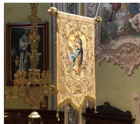
● STENDARDO DELL'IMMACOLATA ESPOSTO NEL PRESBITERIO DELLA CHIESA DI CARIMATE ●

Al termine di tutte le messe (7 e 8 dicembre) vendita tradizionale delle mele.