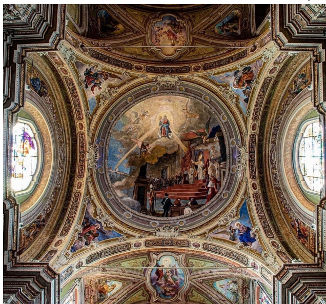
• VOLTA PRINCIPALE CHIESA PARROCCHIALE DI CARIMATE •

Da una riflessione di padre Ermes Ronchi: L'angelo Gabriele, lo stesso che «stava ritto alla destra dell'altare del profumo» (Lc 1,11), è volato via dall'incredulità di Zaccaria, via dall'immensa spianata del tempio, verso una casetta: dal sacerdote anziano a una ragazza, dalla Città di Dio a un paesino senza storia della meticciosa Galilea, dal sacro al profano. Il cristianesimo non inizia al tempio, ma in una casa. La prima parola dell'angelo, il primo "Vangelo" che apre il vangelo, è: rallegrati, gioisci, sii felice. Apri la gioia, come una porta si apre al sole: Dio è qui, ti stringe in un abbraccio, in una promessa di felicità. Le parole che seguono svelano il perché della gioia: sei piena di grazia. Maria non è piena di grazia perché ha risposto "sì" a Dio, ma perché Dio per primo ha detto "sì" a lei, senza condizioni. E dice "sì" a ciascuno di noi, prima di qualsiasi nostra risposta. Che io sia amato dipen-